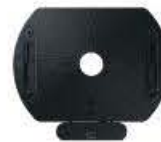
Samsung VG-ARAB22WMTXC Automatisch drehbare Wandhalterung Bestell-Nr. 802104

Vertikal oder horizontal? Sie haben die Wahl: Drehen Sie einfach Ihren Bildschirm mit den neuen Wand- und Ständerhalterungen. Die lückenlosen Halterungen platzieren Ihren QLED-Fernseher bündig an der Wand und sorgen dafür, dass er sich wunderbar in Ihr Zuhause oder Büro einfügt.