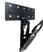
Samsung WMN-M15EA/XC Lückenlose Wandhalterung Bestell-Nr. 630485