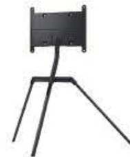
Samsung VG-SESB11K/XC Studioständer Bestell-Nr. 716865