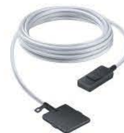
Samsung VG-SOCA05/XC Ein-Kabellösung 5m Bestell-Nr. 812219